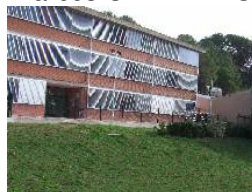
IES SERRALLARGA (Blanes, Gerona) Lourdes DOMENECH