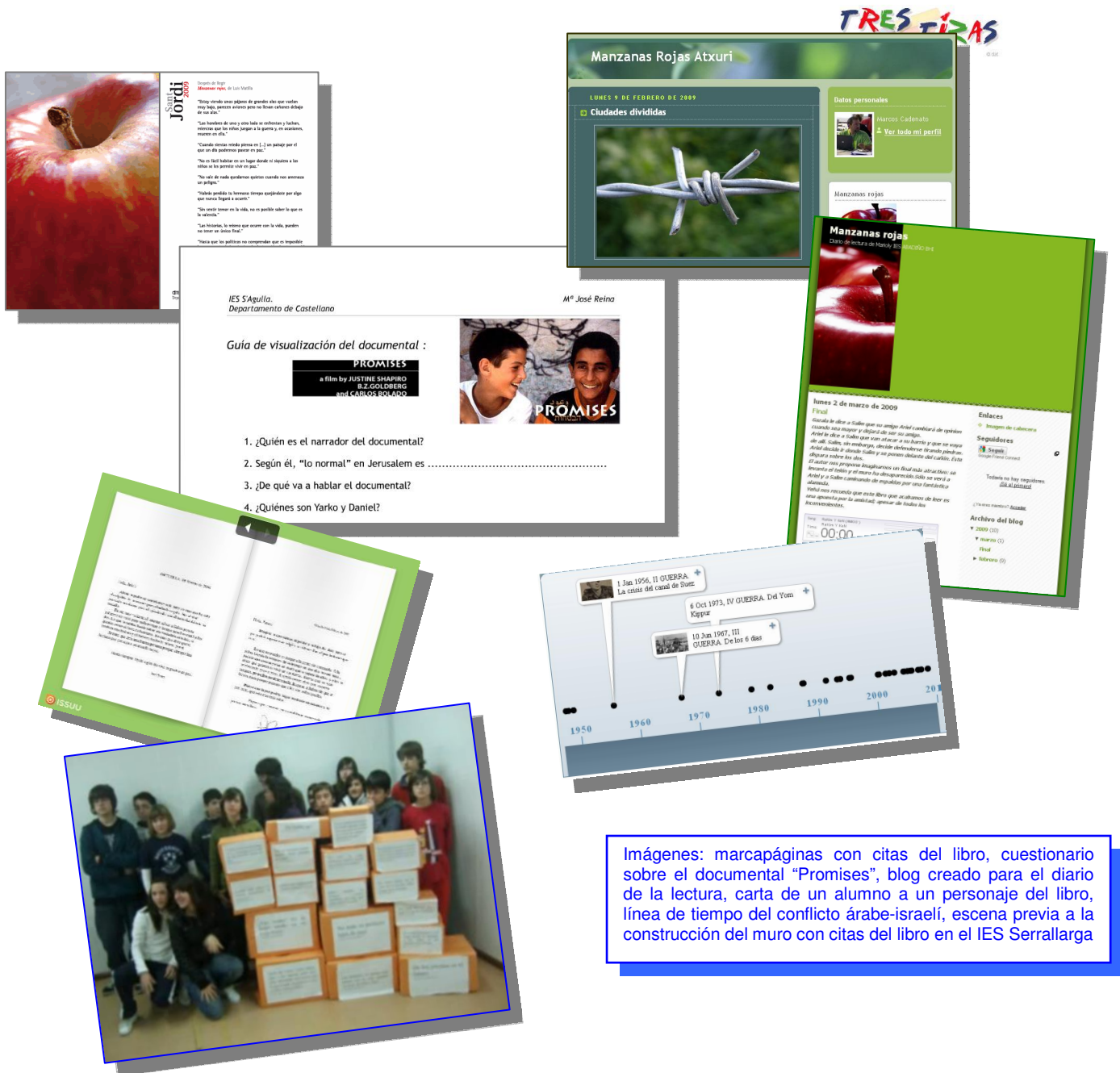
Imágenes: marcapáginas con citas del libro, cuestionario sobre el documental "Promises", blog creado para el diario de la lectura, carta de un alumno a un personaje del libro, línea de tiempo del conflicto árabe-israelí, escena previa a la construcción del muro con citas del libro en el IES Serrallarga