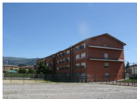
IES ABADIÑO (Abadiño, Bizkaia) Aster NAVAS